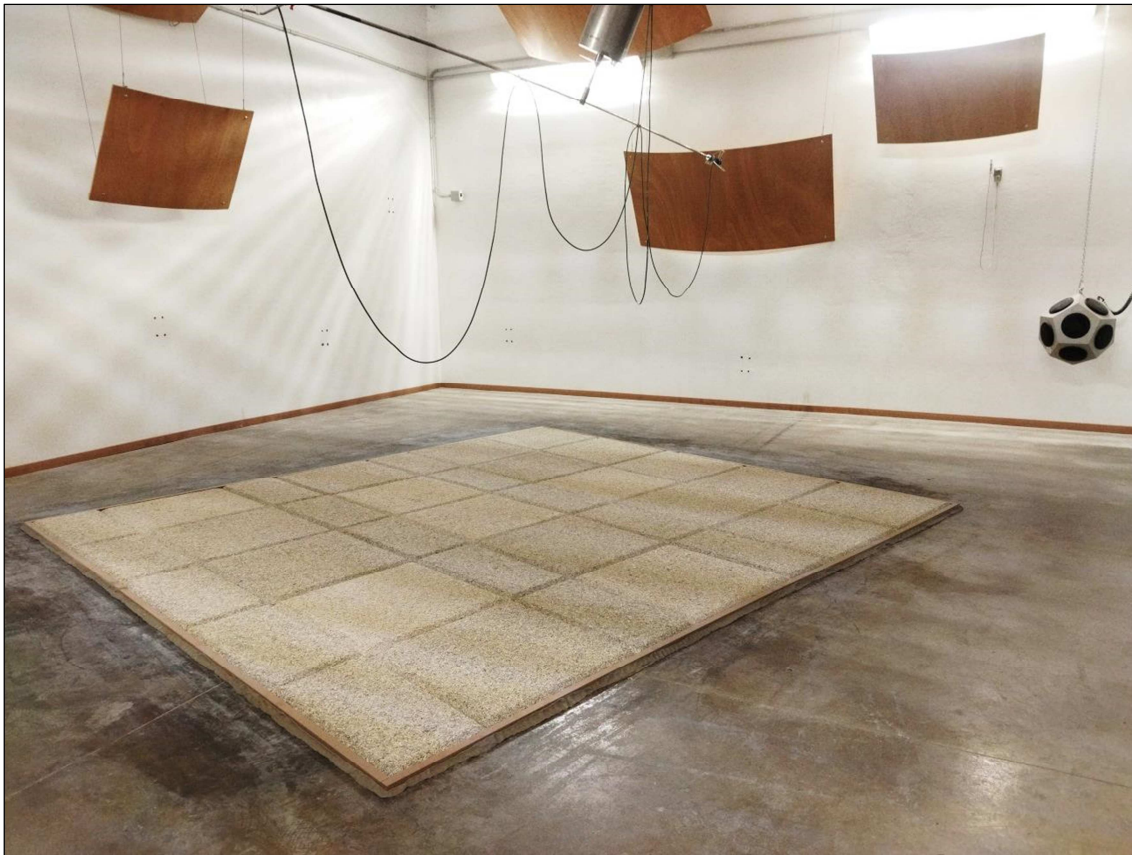
Fotografia dell'oggetto Photograph of item