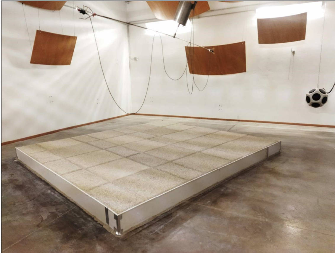
Fotografia dell'oggetto Photograph of item